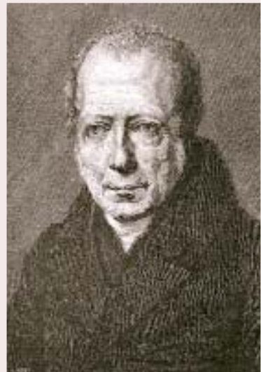
Retrat de Wilhelm von Humboldt. (Dibuix de Joseph Schmeller).

Imagineu un home del nord com Humboldt, avesat a veure les altes muntanyes dels Alps. Avesat a veure cims nevats, glaceres, planells lacustres i boscos d'avets. Avesat a veure la muntanya en el seu