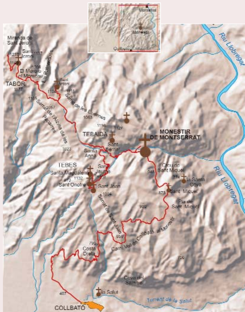
L'itinerari que va fer W. Humboldt en el seu viatge a Montserrat: de Collbató va seguir el Camí Vell fins al monestir. L'endemà de l'arribada, parteix cap al cim de Sant Jeroni i cap a les ermites.

marc més imponent, més inexpugnable. Aquest paisatge no hi era a Montserrat; no obstant això, aquesta muntanya posseïa una singularitat que la feia única, tenia uns trets inimaginables que no havia trobat mai en cap altra muntanya del món.