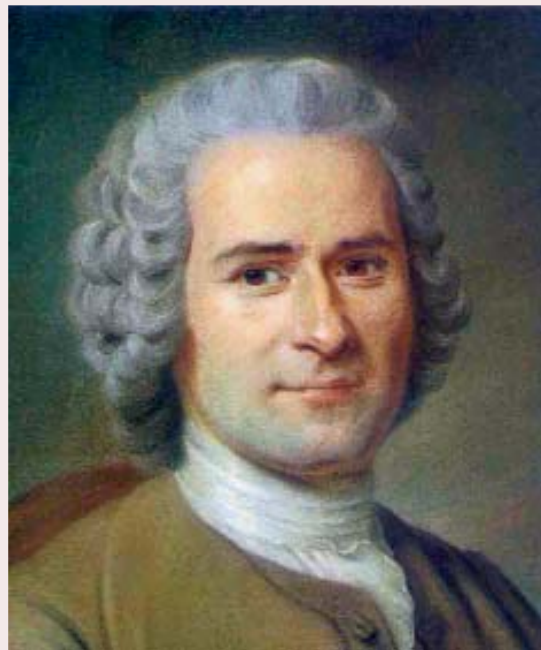
Jean-Jacques Rousseau, un dels més grans pensadors del segle XVIII, en un retrat de Maurice-Quentin de la Tour: M. Rousseau, ciutadà de Ginebra (1753).