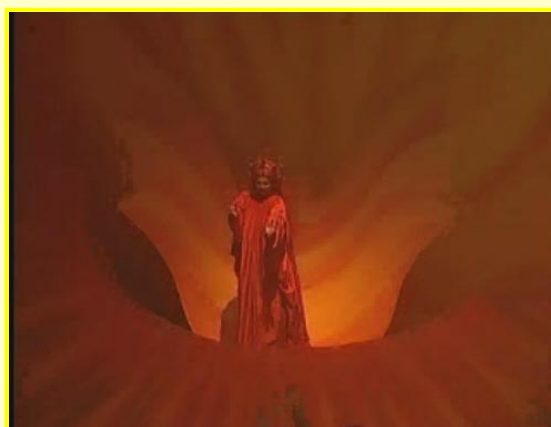
Lucifer en una producción de los Dramas Misterio de Rudolf Steiner en el Goetheanum

(1) Sólo se pueden conceder descuentos si se adjunta una prueba/copia o número de miembro y es válido para estudiantes, alumnos, jubilados/superiores, desempleados, aprendices, personas que realizan el servicio militar/civil, personas con discapacidades (IV pensión) y miembros de la Sociedad Antroposófica General.