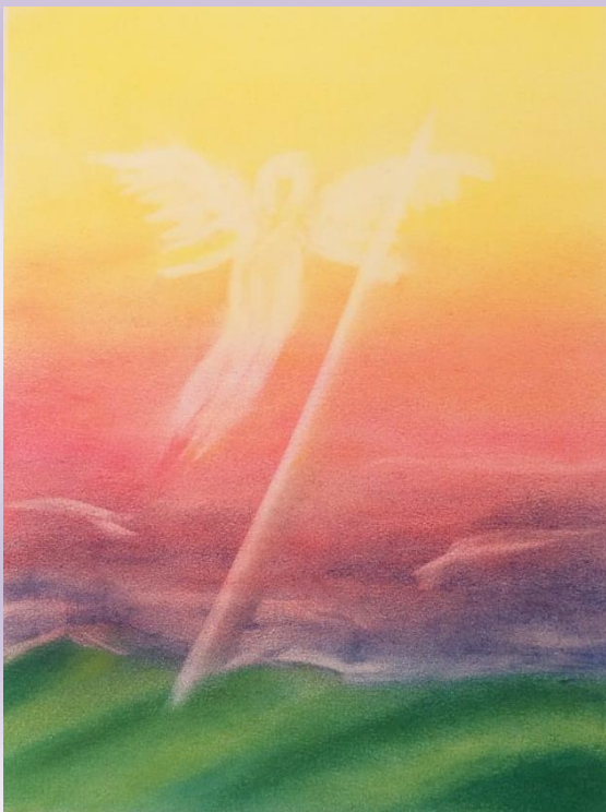
Aquarel·la del taller de pintura "Transicions" a la seu de la Comunitat