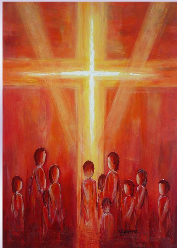
Sota la Creu. Gertrud Deppe.

En el comunicat de febrer de la Federació enviat per e-mail el 6 de feb, es pot veure un resum d'aquesta reunió.