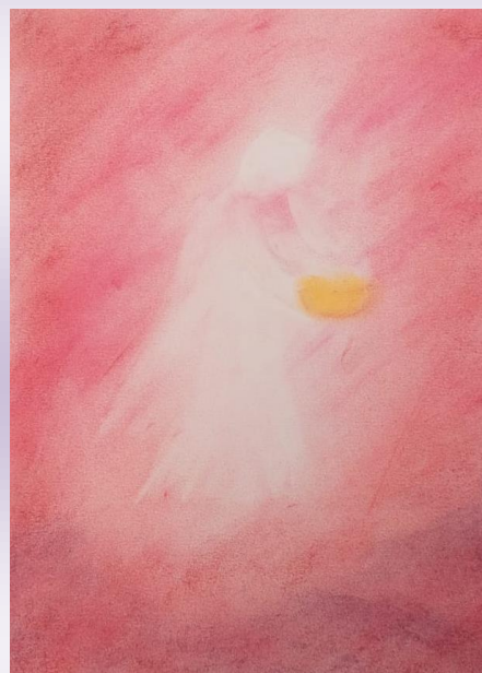
Obra hecha en el Taller de pintura, "Transiciones", en la sede de la Comunidad