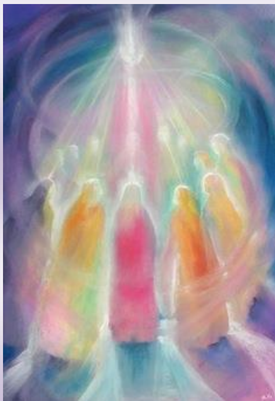
EL Jo i la Comunitat

La Comunitat de Cristians no rep cap tipus de subvenció o ajuda oficial. Des del seu origen, com a moviment renovat i autònom existeix gràcies a l'esforç i a les donacions lliures dels membres i amics.